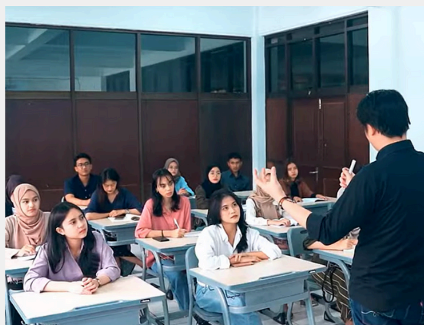
Dosen Tenaga Pengajar